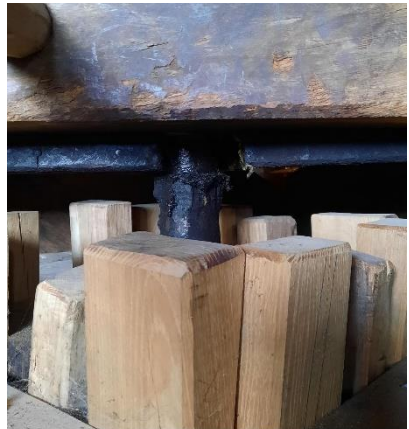
Speling tap met neuten