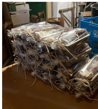
Kerstpaketten - nog ???

Het jaar hebben we afgesloten met de feestelijke verlichting aan het stellinghek en de schijnwerpers van de molen aan. Tenslotte verstuurden we kerstkaarten naar de vrienden van de molen.