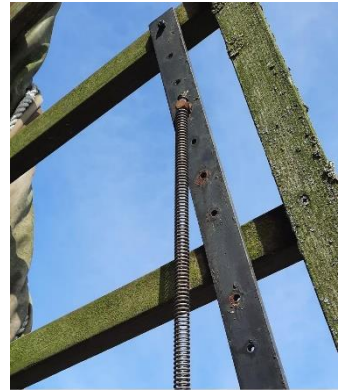
Veer - remklep

Er zullen namen voorkomen die u niets zeggen. Schroom niet de molen te bezoeken en vragen staat vrij. De molenaars zullen u alles vertellen en uitleggen.